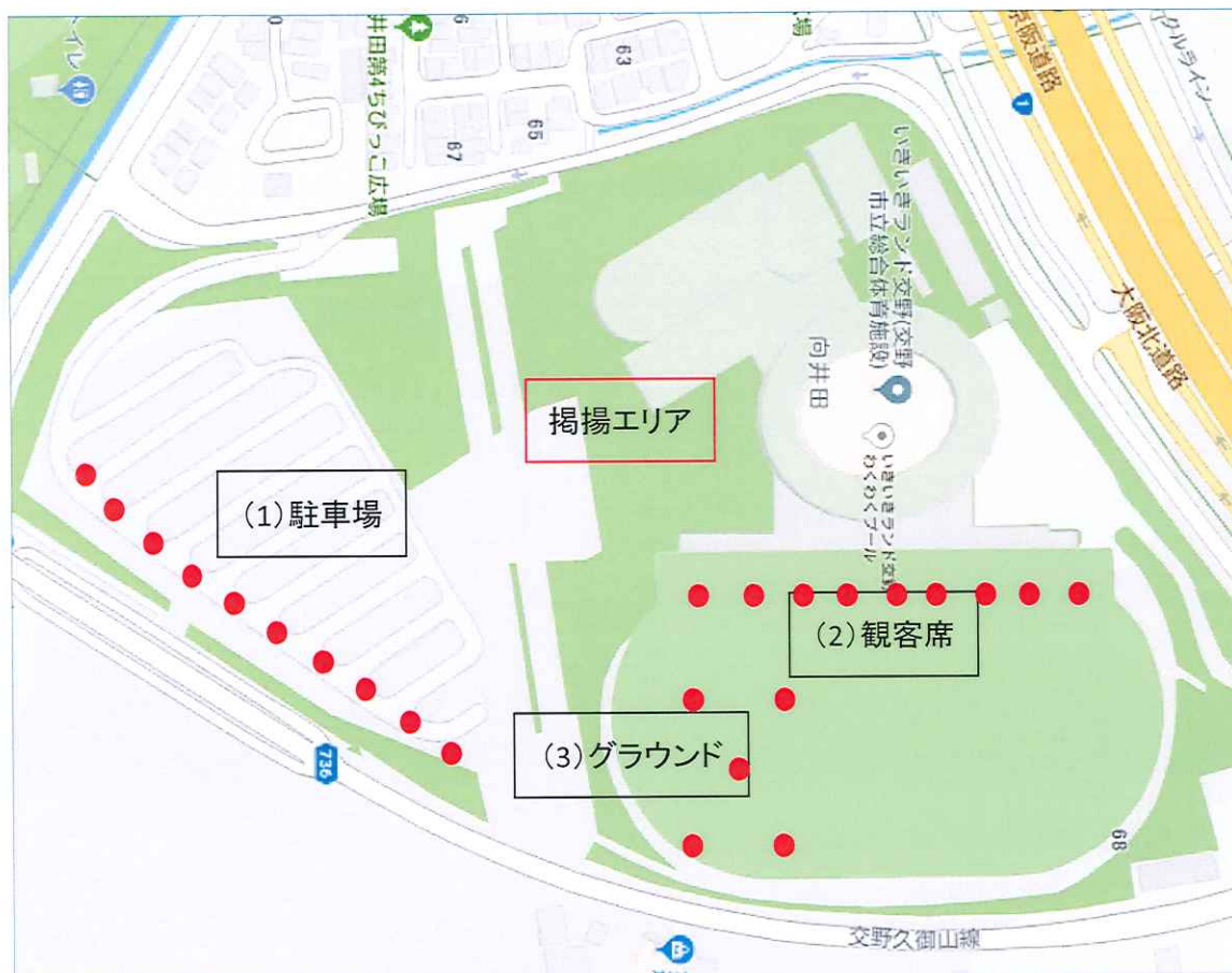
いきいきランド交野